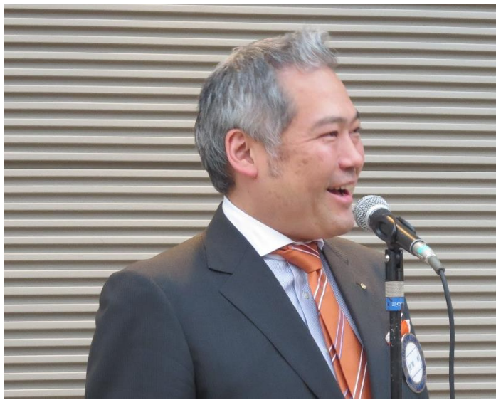
尾関会長の点鐘、挨拶よりスタート致しました。

2014年7月1日(火)は、2014-15年度第1回例会ということで、夜間キックオフ例会を、東京アメリカンクラブ テラスSplashにて行いました。雨も降らず、気持ちの良い風の中、皆さん美味しいお料理とお酒を片手に、とても楽しい時間を過ごされました。